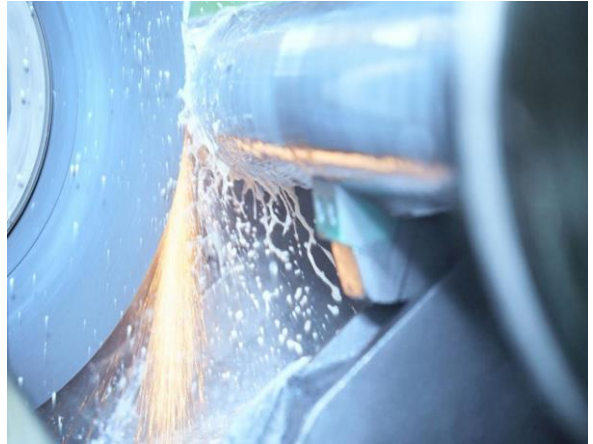
Vom Entwurf in die Fertigstellung

Sonderausführungen oder grössere Dimension werden selbstverständlich auch angeboten