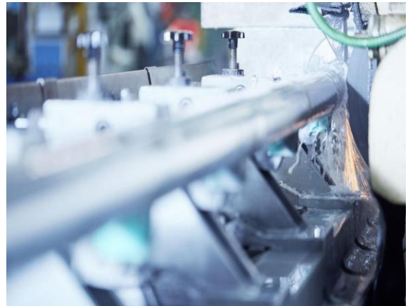
Drehen | Schweißen | Montieren | Kontrollieren